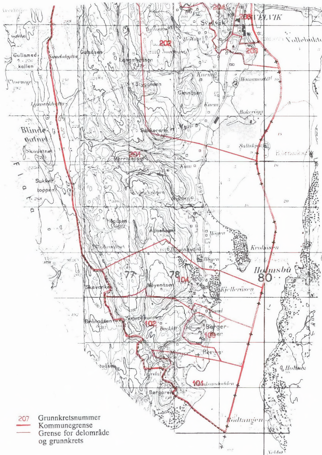
Kartgrunnlag M ca. 1:50 000 Tillatelsenr. 74/91 Statens kartverk